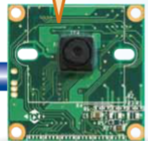
カメラモジュール VS-CAM-01