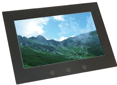
静電容量式WVGAタッチパネルLCD LCD-KIT-B01(オプション)