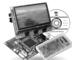
*写真はLCDセットです。