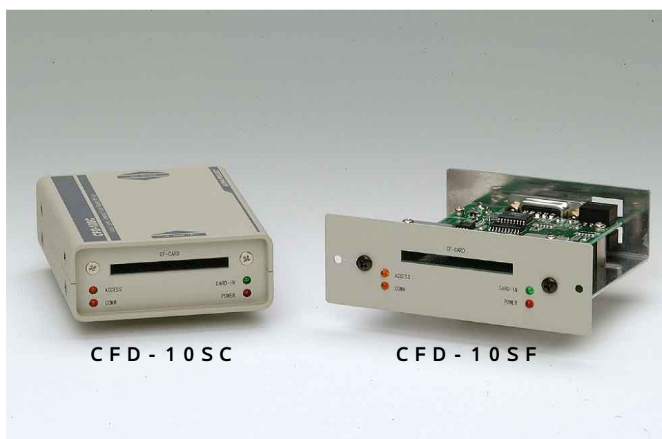
CFD - 10SC

DOS互換ファイルシステム搭載！ 簡単なコマンドだけでコンパクトフラッシュを 操作できるリーダー/ライター。