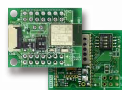
Bluetoothモジュール BTシリーズ