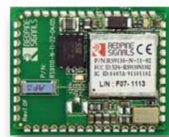
無線LANモジュール WM-RPシリーズ