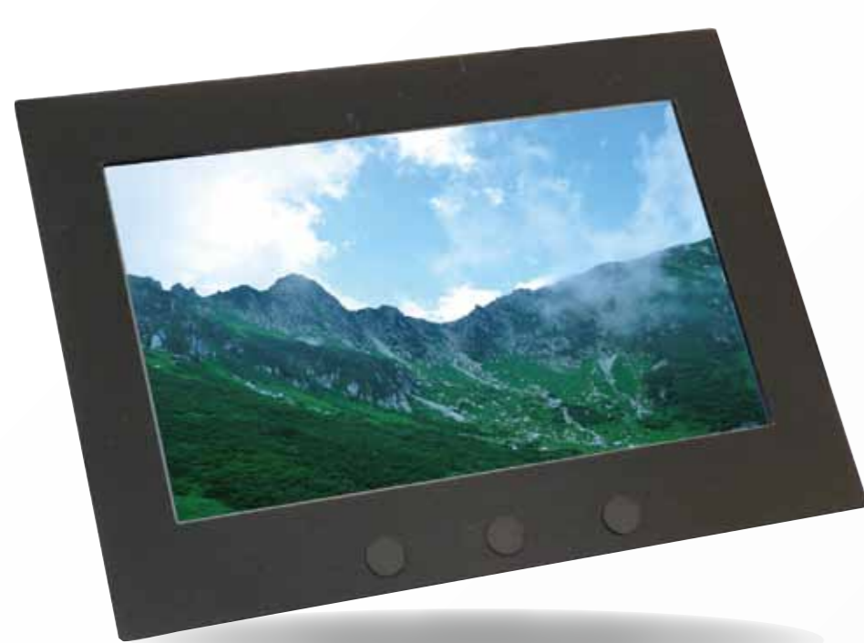
静電容量式WVGAタッチパネルLCD LCD-KIT-B01