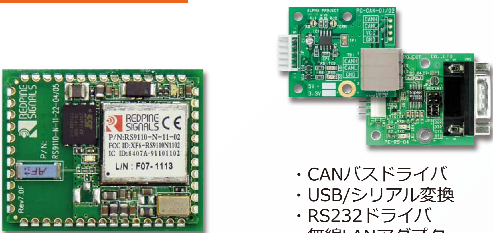
無線LANモジュール WM-RPシリーズ